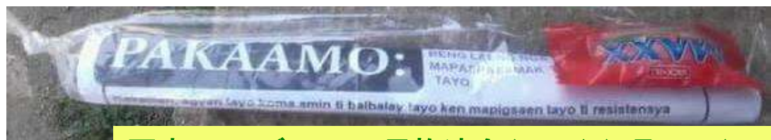
写真:コルディリエル民族連合(CPA)(4月12日)

■ CExCI(住友金属鉱山も40%出資)による鉱山探査事業に周辺州の住民と反対