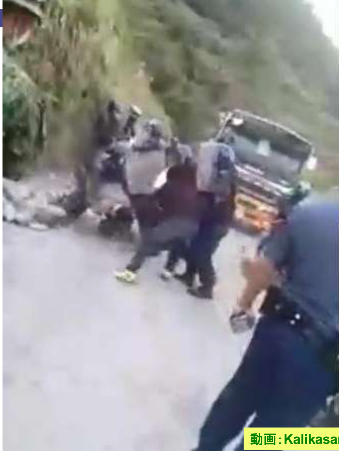
動画: Kalikasan-PNE Facebookより