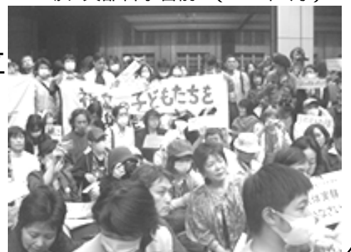
子ども20ミリシーベルト抗議行動 於：文部科学省前 (2011年5月)