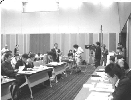
平野復興大臣に避難者への支援の継続を要請 (2012年11月)