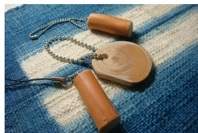
<ストラップ/キーホルダー>

今回の携帯ストラップ/キーホルダーは、飯能市にある「きまま工房・木楽里」さんの協力を得て、「西川材」を使用し、スタッフが一つ一つ手作りでご用意します。