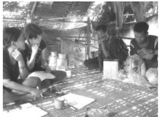
先住民族への聞き取り調査(マレーシア)

サハリンII石油・天然ガス開発、フィリピン・コーラルベイニッケル製錬事業、マレーシア・パハン-スランゴール導水事業、フィリピン・サンロケダム灌漑事業等のプロジェクトを中心に、JBIC、JICA、日本政府、国会議員等への様々な働きかけを通じて、事業の影響の回避、緩和、解決を目指し活動しました。