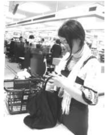
「脱・使い捨てNEWS」特集でレジ袋有料化を取材

国内外のネットワークを生かして収集した「脱・使い捨て」に関する様々な取組みや、調査研究による見解等を市民にわかりやすく伝えるメディアとして、「脱・使い捨てNEWS」を創刊しました。