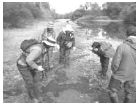
ビキン川アムールトラツアー

具体的解決策を提案することで将来的にそれを守る可能性を拡大することにつながったはずですが、また、野生の生息地を体験するエコツアーを企画・実施し、10名が参加しました。