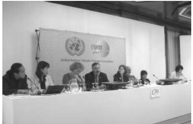
国連会合でのNGO記者会見(左端が FoE Japan)

期間中、最新の交渉情報や FoE Japan の主張を会議場の日本記者へのブリーフィングやウェブサイト等を通じて伝え、1月に報告会を開催しました。