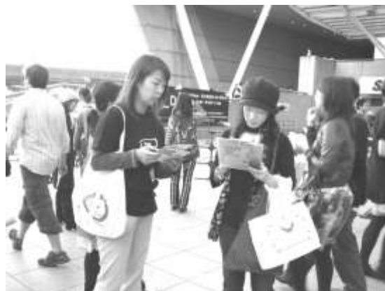
コンサート会場での署名活動

FoE Japan は、キャンペーンの事務局として全体の企画運営を行うとともに、英国の気候変動法の成立に大きな影響を与えた FoE 英国の THE BIG ASK キャンペーンからの支援を受け、英国ロックグループ、レディオヘッドの日本ツアー会場等で大規模な署名アクションを行い、若者を中心とする幅広い層の参加を促しました。