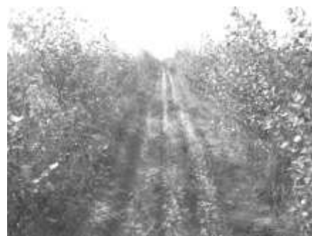
畑の利用が広がったダチンノール村

活動地では、3～4年で緑が回復し、砂が固定され、畑などに活用できるようになりますが、緑化後の管理を続けしないと、家畜の食害などで、また砂漠に逆戻りする危険もあります。活動地を広げる一方で、回復した緑を守ることも必要なため、現地体制の強化を図りました。現地滞在ボランティアや協力者が活躍し、育苗、炭焼き、樹木の成長実験など様々なことができました。