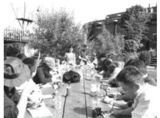
ドイツツアーでエコロジカルな住宅の説明を聞く

ドイツを参考に日本で2001年より開始された、自治体の持続可能なまちづくりのための施策を評価するコンテスト、「環境首都コンテスト」に、主催団体ネットワークの一員として加わりました。関東地域での勉強会、交流会の開催、自治体への参加呼びかけ、参加自治体の採点、ヒアリング、およびボランティア・コーディネートを行いました。